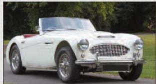
2013 | Austin-Healey 3000 MKI