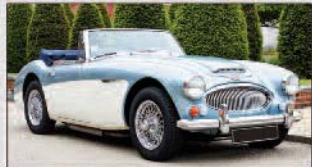
2014 | Austin-Healey 3000 MKIII BJ8