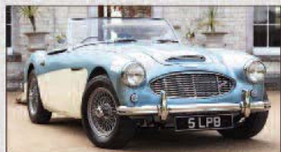
2016 | Austin-Healey 3000 MKI BN7