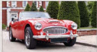
2012 | Austin-Healey 3000 MKIII BJ8

regardez www.rawlesmotorsport.com pour beaucoup plus d'exemples