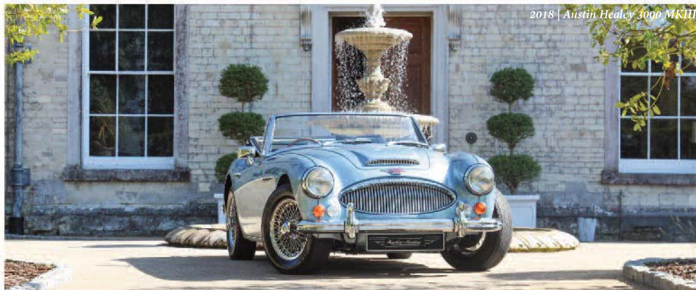
2018 | Austin-Healey 3000 MKIII

reconstruction de moteur - restauration - sellerie - carrosserie - peinture - ventes/achats de voitures - mises à niveau