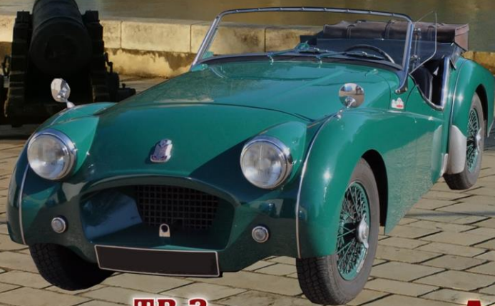
TR 2 les 70 ans