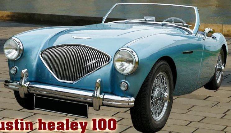
Austin healey 100 les 70 ans