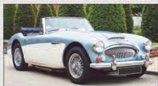
2014 | Austin-Healey 3000 MKIII BJS