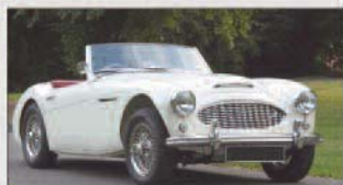
2013 | Austin-Healey 3000 MKI