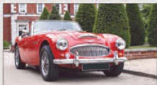
2012 | Austin-Healey 3000 MKIII BJS

regardez www.rawlesmotorsport.com pour beaucoup plus d'exemples