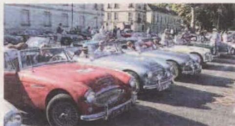
Hier matin, une belle brochette d'Austin Healey au départ du rallye touristique. Ce dimanche toutes resteront sur Chinon.

L'essai de l'an passé semble en voie d'être transformé. La commémoration du Grand Prix de Tours a trouvé à Chinon un port d'attache très apprécié.