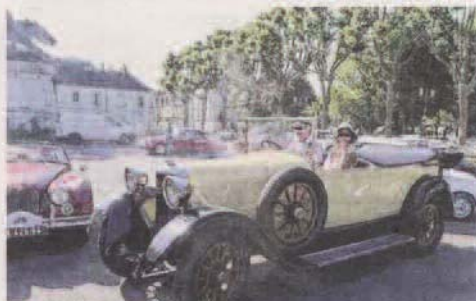
De vrais bijoux que ces voitures de collection bichonnées par des propriétaires amoureux des belles mécaniques.