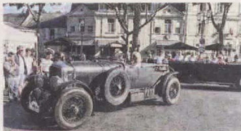
Impressionnantes, les Bentley des années 30 semblent dotées de moteurs surpuissants et éternels.

tures de collection, dans l'idée de commémorer le mythique Grand Prix de Tours, avait dû abandonner le cœur de la cité tourangelles, pour cause de place à laisser au tramway. Chinon avait su reprendre la balle au bond, avec des arguments pour séduire non seulement les organisateurs, mais aussi la grande proportion de participants d'origine britannique, qui apprécient ce genre de rassemblement, s'il est accompagné d'un volet touris-