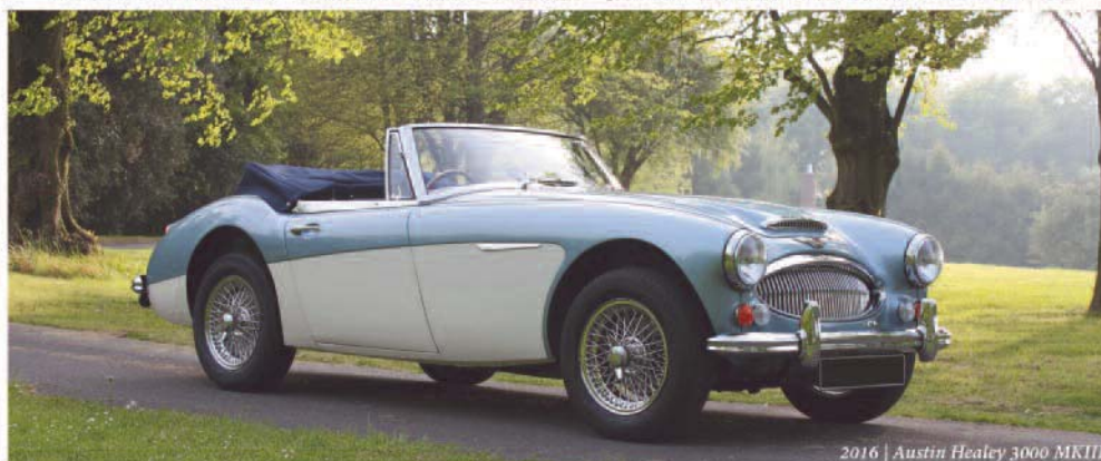
2016 | Austin Healey 3000 MKIII

reconstruction de moteur - restauration - sellerie - carrosserie - peinture - ventes/achats de voitures - mises à niveau