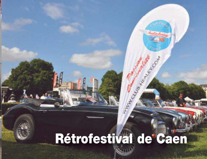
Rétrofestival de Caen