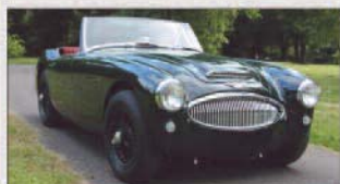
2015 | Austin-Healey 3000 MKII