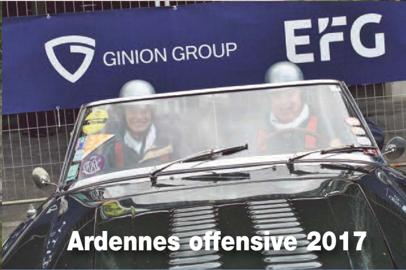
Ardennes offensive 2017