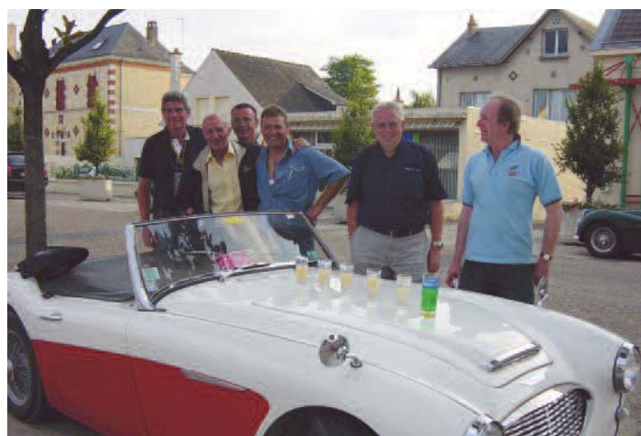
Village d'Arnage côté Club - Test du 6 cylindres en ligne !