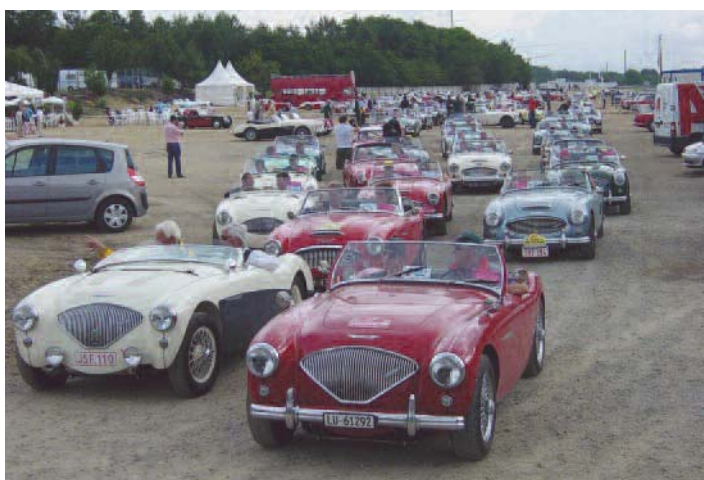
Départ du traditionnel tour de piste