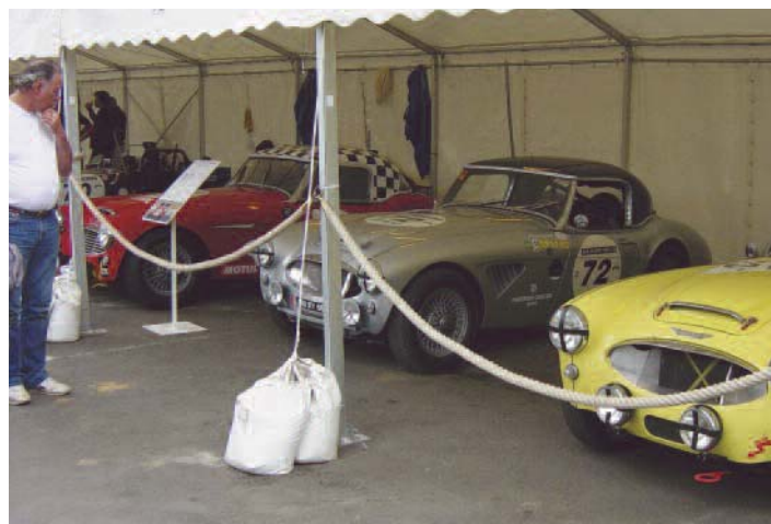
Côté paddock, déjà du beau monde !