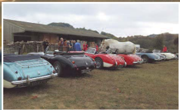
Une virée dans le Perche